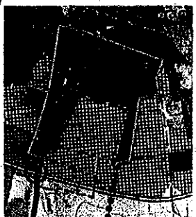
WYRYS ZE STUDIUM UWARUNKOWAŃ I KIERUNKÓW ZAGOSPODAROWANIA PRZESTRZENNEGO GMINY STRZELCE OPOLSKIE W REJONIE SUCHYCH ŁANÓW